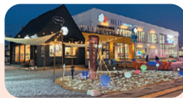
▲冬季期間はイルミネーションの幻想的な光に包まれます