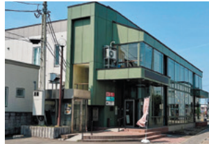
▲金融機関旧店舗を活用した建物のガラス窓が広く明るくて開放的!

2階の空手道場はレンタル可能。ランチ会などで楽しむ親子もいるそうです。柔らかい床なので、ハイハイする赤ちゃんも安心。授乳ができる個室もあります。カフェ前のテラスでは、親子で楽しめるワークショップも開いています。