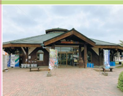
▲美しい八角形のカナディアン・ログ・ハウスが山並みの景色に映える「観光物産館 四季彩館」