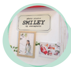
▲撮影プランに応じて、お気に入りのアルバムやフォトフレームなどが選べます

すべての記念日に対応しているので、長くおつきあいのできるフォトスタジオです。お祝いの機会にぜひ家族写真を撮ってみてはいかがでしょうか。(記事：葛西)