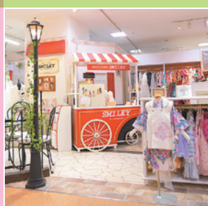
▲入口の素敵な演出に胸がドキメキます♪

さくら野弘前店に2017年3月にオープンしたフォトスタジオ。入口を彩るおしゃれな装飾にドキドキワクワク、胸が高鳴ります♪