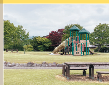
▲きれいに整備された芝生広場は子ども連れのピクニックにおすすめの場所