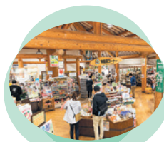
▲観光物産館には県内の特産品・名産品が充実！産直コーナーや喫茶コーナーも人気♪