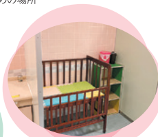
▲トイレにはオムツ交換用のベビーベッドが設置