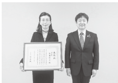
12月11日奥田副知事から表彰状を伝達

青森県では、男女共同参画社会の実現に向けて、顕著な功績のあった個人及び団体の功績を称えるとともに、男女共同参画社会づくりに対する県民の皆様の一層の関心を高め、男女共同参画社会の形成を促進するため、知事表彰を実施しています。