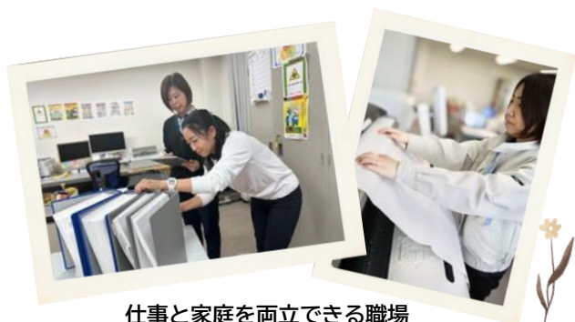
仕事と家庭を両立できる職場

この意見交換会を行うことで社員の困りごとや要望に積極的に対応していこうという風土ができました。中には自分の考えを周囲に伝えるのが苦手な人もいますが、そういう人の考えを拾える場にもなっています。普通であれば私たち経営層が見たり聞いたりできないような内容の悩みも、この会で聞くことができると