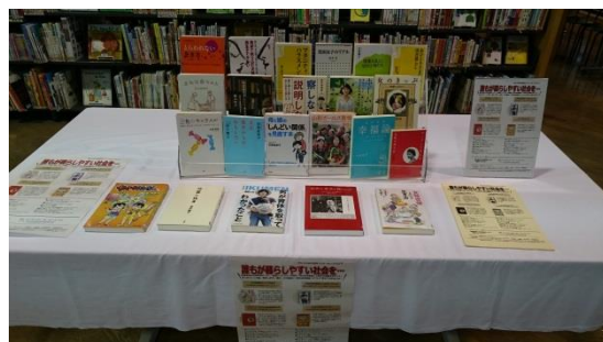
「パッケージ貸出」展示の様子 展示場所：田子町立図書館