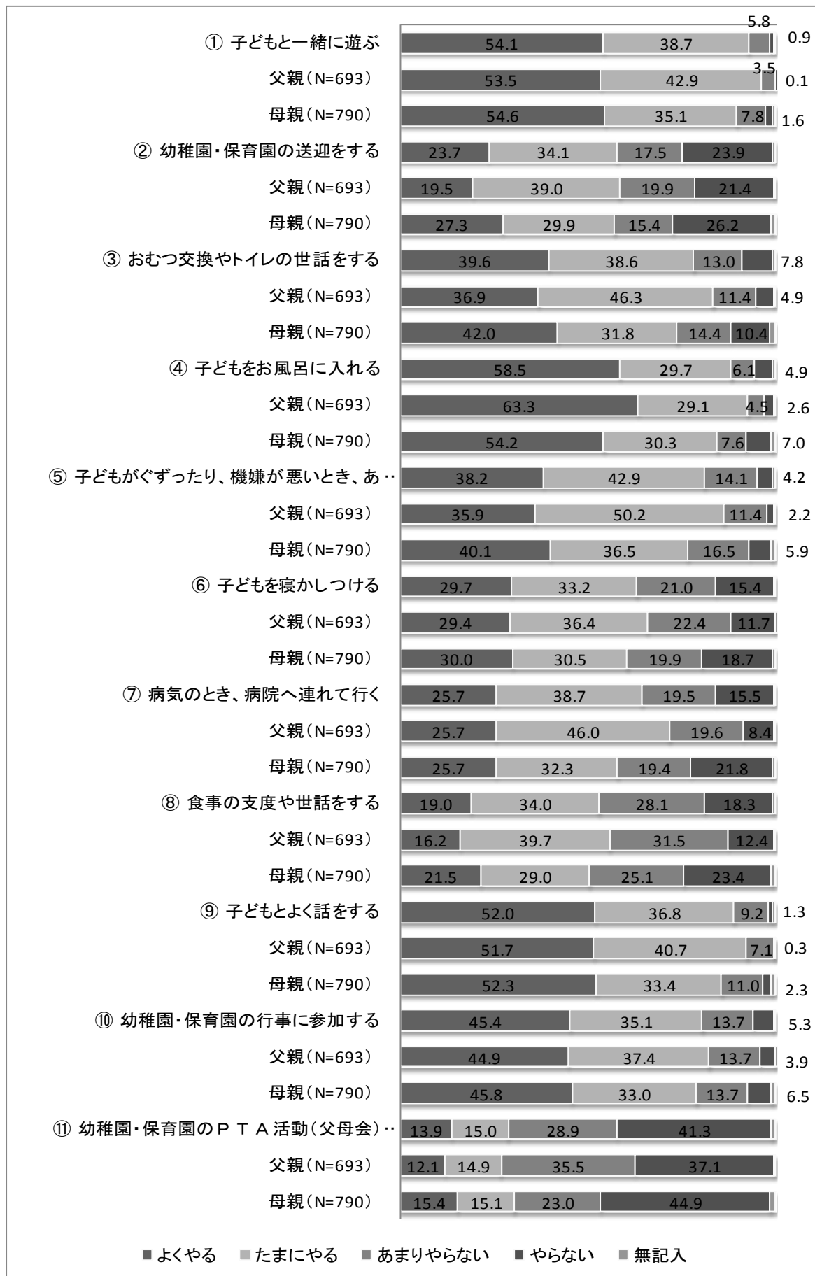
図 8-1 父親の子育てへの参加 [父親・母親の比較]