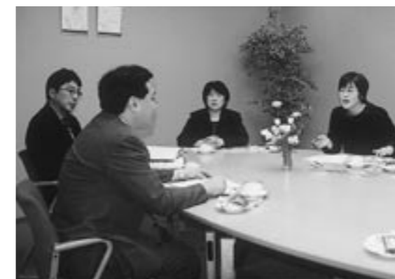
トークトーク。話が弾んで、時間オーバーに。