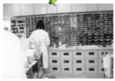
新しい薬の勉強は欠かせない