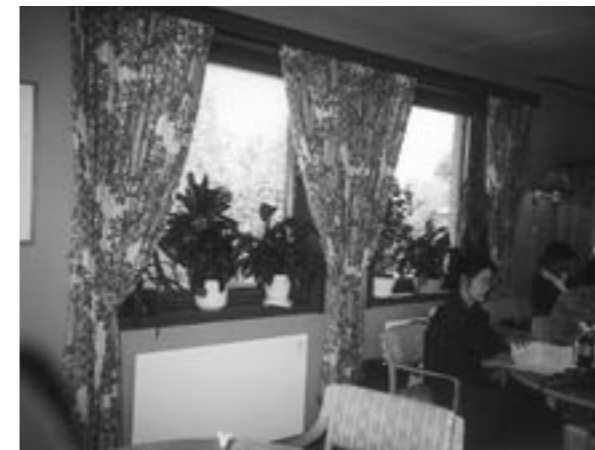
カラフルなカーテンがすてきなオスロの病院