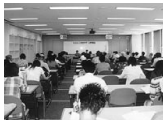
7月18日の報告会の様子

会場に集まった参加者は青森県のマスメディアの現状と課題について熱心に聞いていました。